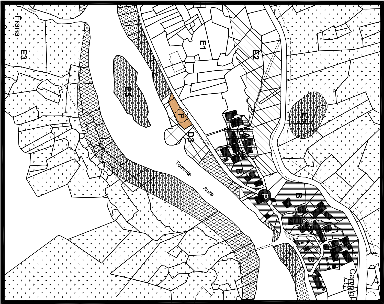
VARIANTE PARZIALE VP1/11 TAVOLA P2a